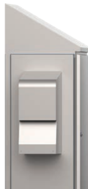
Equipo de aire acondicionado para entornos extremos

Los equipos de aire acondicionado Slim Fit están especialmente diseñados y desarrollados para satisfacer los requisitos de los clientes industriales. Además, son fáciles de especificar y están listos para su uso. Estos equipos de aire acondicionado ofrecen una flexibilidad óptima y se pueden montar en el exterior, semiempotrados o completamente empotrados, según el espacio disponible.