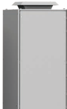
Unidad de ventilador exterior de montaje en techo RFU