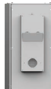
Intercambiador de calor

El equipo de aire acondicionado Extreme cuenta con un diseño que lo protege contra la entrada de agua y partículas, y está listo para utilizarse en los entornos más exigentes. Se trata de la única unidad del sector que ofrece un nivel de protección IP66 e IP69.