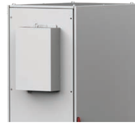
Intercambiadores de calor aire-agua

Hay diferentes tipos de modelos para todas las aplicaciones, con potencias que van de los 900 W a los 134 kW. La amplia variedad de opciones y accesorios permite configurar un enfriador a medida.