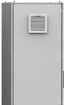
Unidades de ventilador vertical para interiores y exteriores EF/EPF