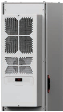
Aire acondicionado interior de montaje vertical