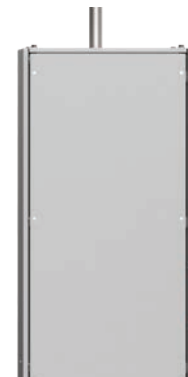
Vortex para interiores y exteriores HT/BP